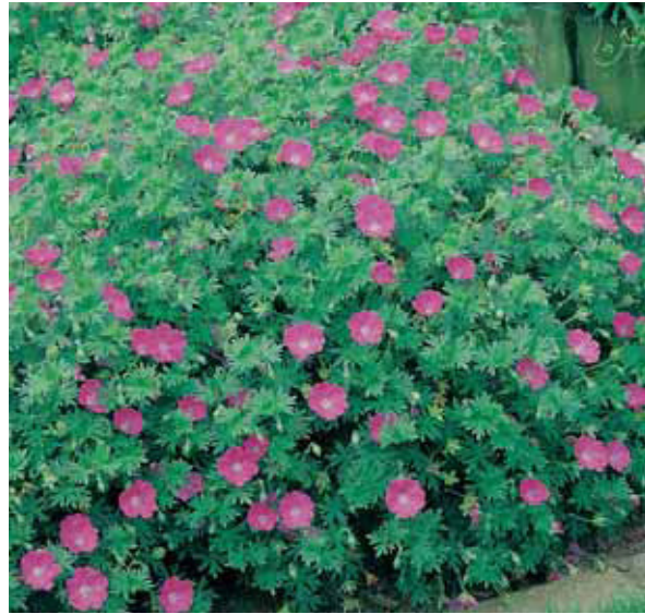
Blutroter Storchschnabel Geranium sanguineum

Lichtbedarf sonnig, Überwinterung im Keller Bodenansprüche nährhaft, durchlässig Bodenfeuchtigkeit mittelfeucht, keine Staunässe! Giessen häufig, im Sommer ein bis zwei Mal täglich Düngen regelmässig, meist wöchentlich Schnitt Rückschnitt im Frühjahr