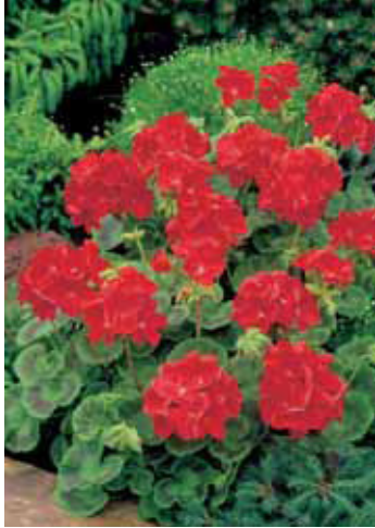
Zuchtgeranie / Pelargonie Pelargonium (alle Sorten)

Pflanzentyp Topfpflanze Wuchshöhe 30 bis 70 cm Lebensdauer einjährig oder mehrjährig Blütezeit zwischen Mai und September Blütenfarbe rosa, rot und weiss Besonderheit keine