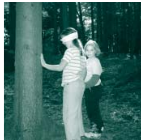
Sinnliche Naturerfahrung am schulfreien Mittwochnachmittag