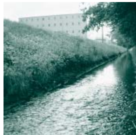
Alpenrhein-Zubringer mit grossem Revitalisierungspotenzial: die Esche

Auch intern stehen Veränderungen an: Eine vorstandsinterne «Arbeitsgruppe Kommunikation» erarbeitet Massnahmen mit dem Ziel, die Anliegen der LGU einer breiteren Öffentlichkeit zugänglich zu machen.