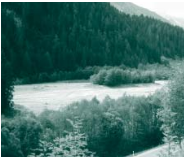
Erfolgreiche Revitalisierung der Inn-Aue in Strada, Unterengadin