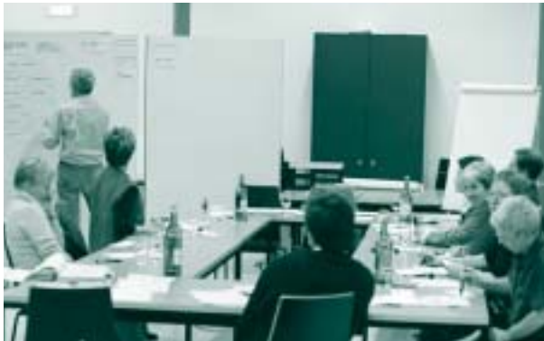
LGU-Vorstand in Klausur

Die LGU setzt sich ein für die Zukunft – mit der Natur.