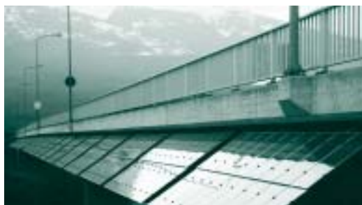
Unumstrittener Eingriff: Solarkraftwerk Rheinbrücke Vaduz-Sevelen