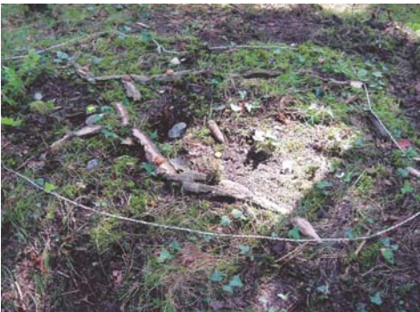
Gestalten von eigenen Minilandscapes

Kinder und Jugendliche gewinnen mit den neuen Modulen einen Überblick über gesellschaftliche Herausforderungen, die sich heute im Alpenraum stellen. Sie erfahren wichtige Zusammenhänge und lernen die "Zukunftswerkstätte" als Methode kennen. Sie stellen sich zum Thema eine nahe, wünschenswerte Zukunft vor und halten fest, was zu dieser Zeit anders ist. Die aufgeschriebenen Gedanken ordnen sie. Anschliessend überlegen sie sich Massnahmen, wie sie das erreichen können. Es ist erstaunlich, wieviele Projektideen dabei entstehen!