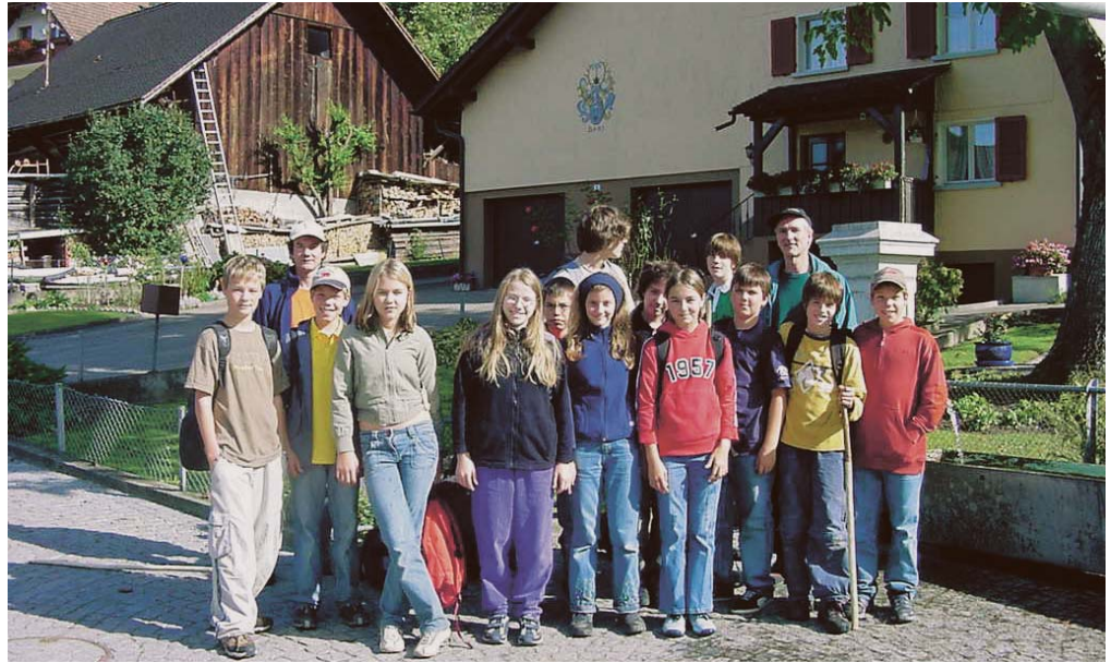
Das Projektteam arbeitete aktiv an der Optimierung der fünf Einzeltage mit

Projektteam aus 14 Jugendlichen erprobt 5 Alpenmodule in Liechtenstein