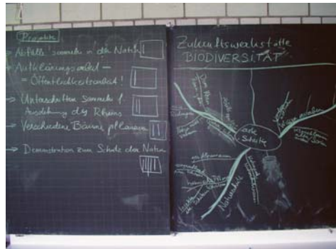
Ideen sammeln und Projekte entwerfen